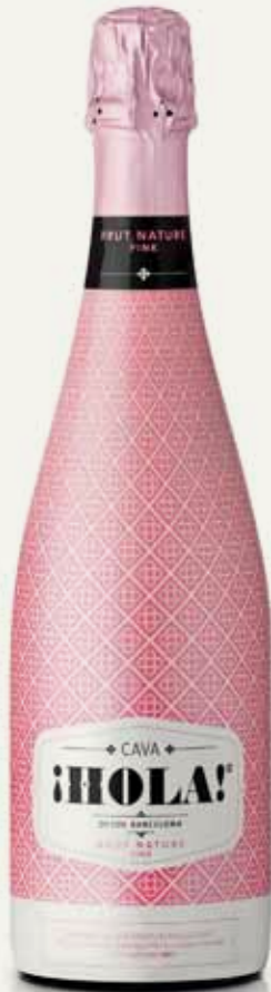
BRUT NATURE PINK